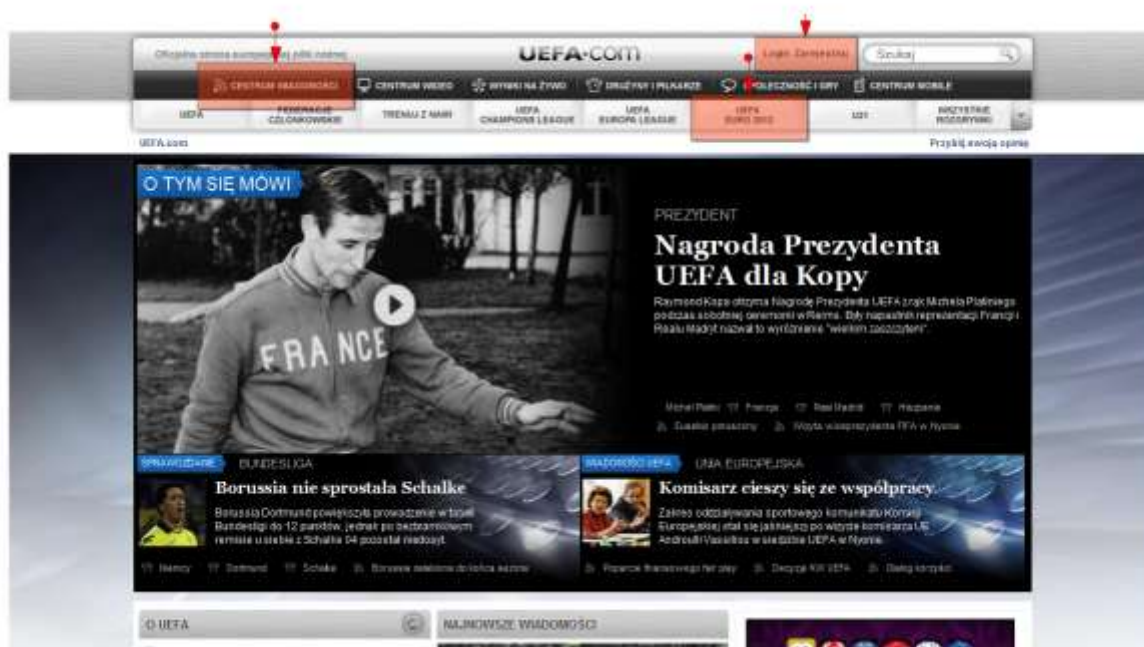
Zrzut ekranu 1. UEFA.com

http://pl.uefa.com/ [automatyczne przekierowanie po wpisaniu w przeglądarkę UEFA.com]