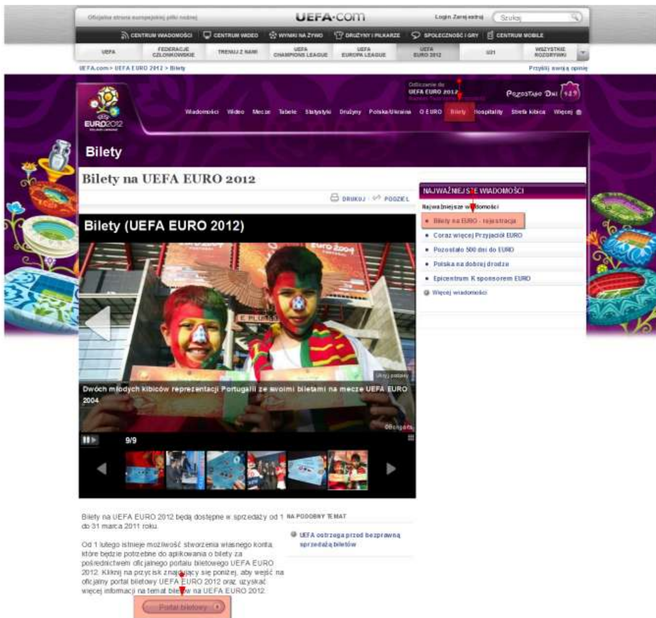
Zrzut ekranu 4. UEFA.com

Element ten był widoczny wcześniej, ale nie wydał się właściwym do zakupu biletów na Euro 2012.