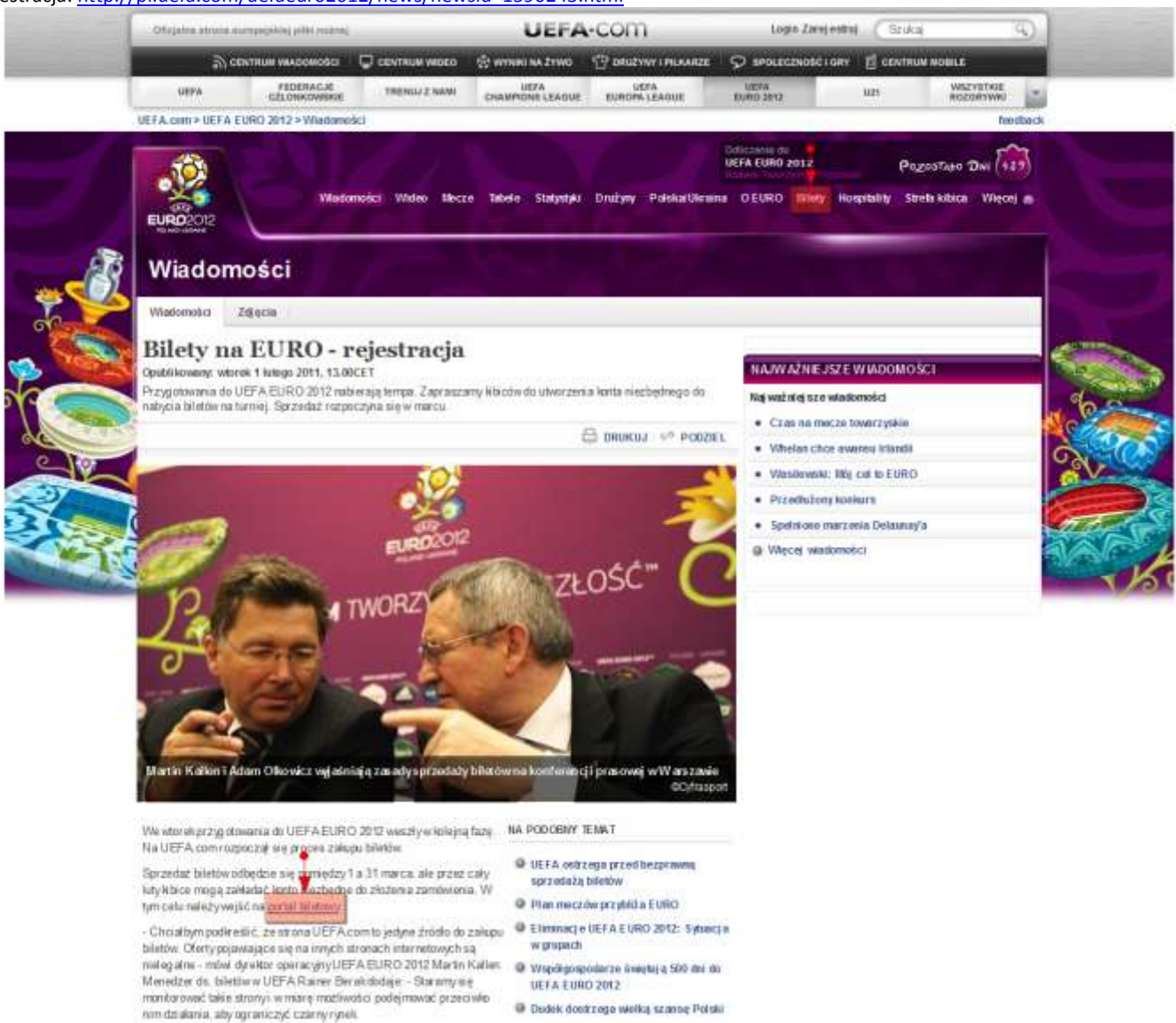
Zrzut ekranu 3. UEFA.com

Czerwonym kolorem zaznaczono elementy, które testerowi wydawały się możliwe jako miejsce do zakupu biletów. Wybrano: Bilety na EURO - rejestracja: http://pl.uefa.com/uefaeuro2012/news/newsid=1590245.html