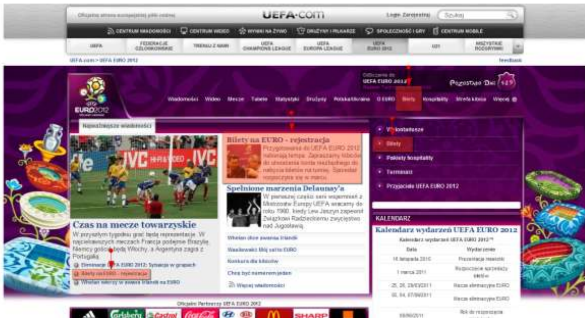
Zrzut ekranu 2. UEFA.com

Czerwonym kolorem zaznaczono elementy, które testerowi wydawały się możliwe jako miejsce do zakupu biletów. Wybrano: Bilety na EURO - rejestracja: http://pl.uefa.com/uefaeuro2012/news/newsid=1590245.html